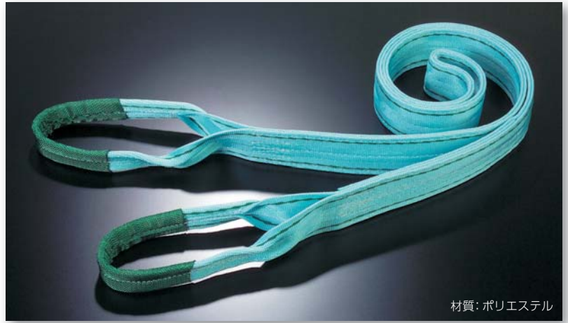
材質：ポリエステル