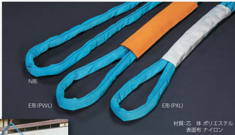
材質:芯 体 ポリエステル 表面布 ナイロン

■超強力パワーを発揮しワイヤーロープ、スリングチェーンに比べソフトで軽量化し、作業性に優れています。