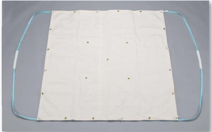
モッコ+別売シート